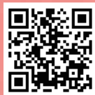
「愛客家-I HAKKA」 FB粉絲專頁