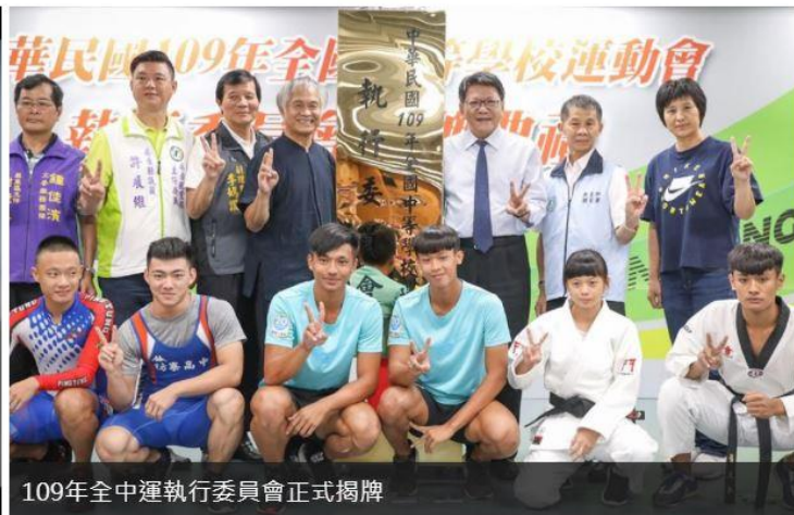
109年全中運執行委員會正式揭牌