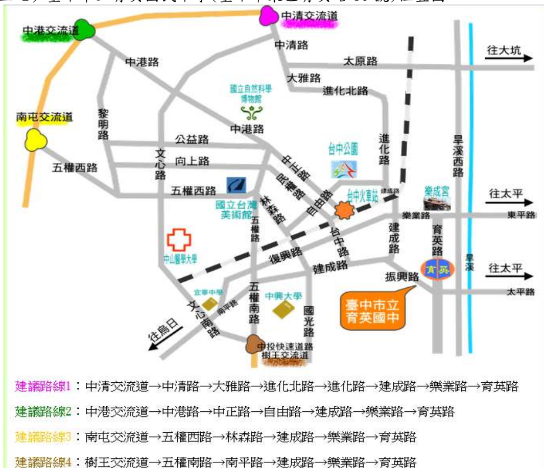
(附件五-2) 臺中市立育英國民中學(臺中市東區育英路 30 號)位置圖

建議路線 5：台 74 線(北屯-霧峰)快速道路→北上樂業路交流道(或南下太平區中山路交流道)→樂業路→育英路