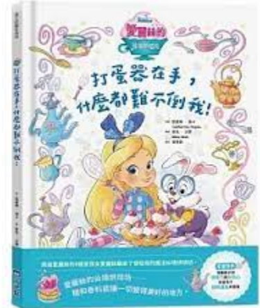
打蛋器在手，什麼都難不倒我