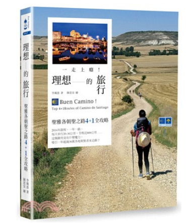
一走上癮！理想的旅行