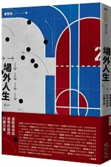
場外人生 | 動員送給迷惘的我們20種力量