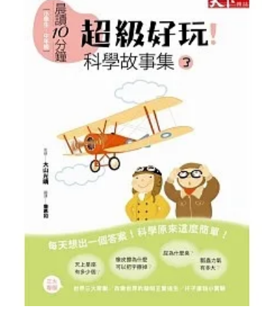
超級好玩！科學故事集 3