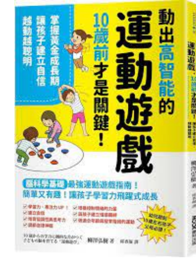
動出高智能的遊戲 | 讓孩子建立自信，越動越聰明