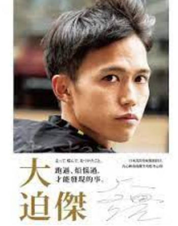
跑過煩惱過才能發現的事