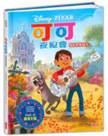
可可夜總會電影原著繪本