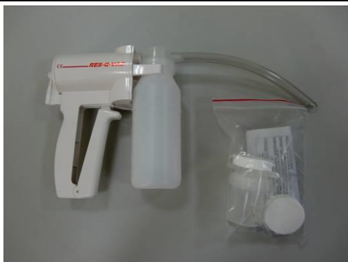
活動式抽吸器(附口鼻咽管)