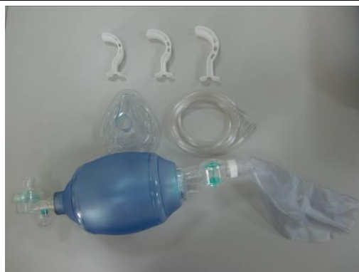
攜帶式人工甦醒器