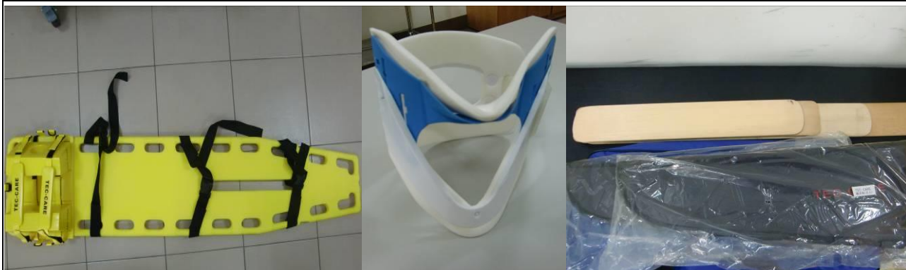
固定器具(軀幹固定器、可調式頸圈、夾板)