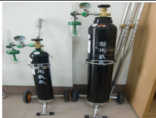
攜帶式氧氣組(附流量表)