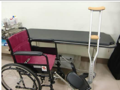
護送器具(輪椅、拐杖、推床)